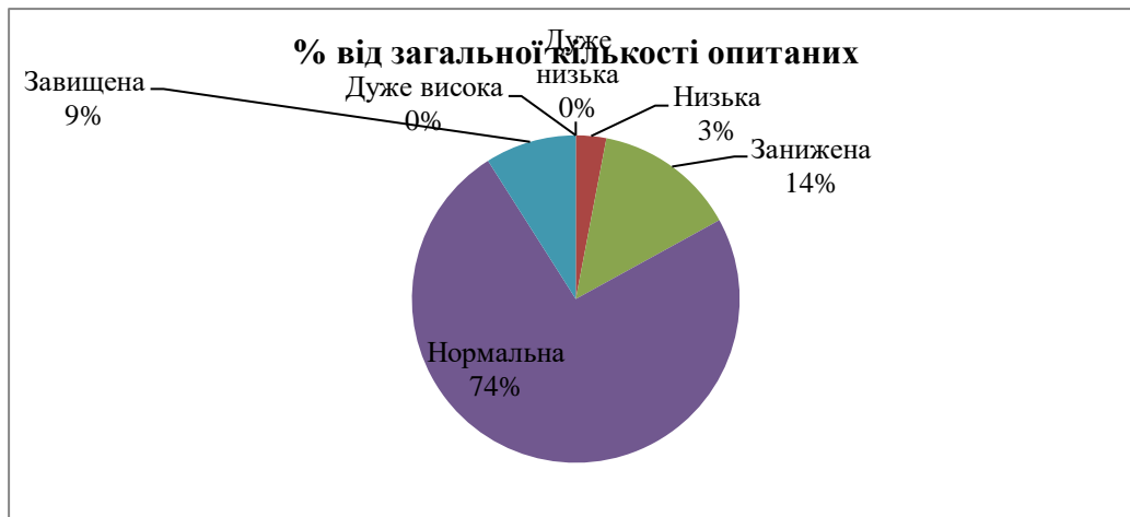
Рис. 3 Самооцінка особистістю своїх якостей

З діаграми на рисунку 3 бачимо, що нормальну самооцінку мають три четверти частини опитаних, дуже високу як і дуже низьку самооцінку не має жоден з опитаних.